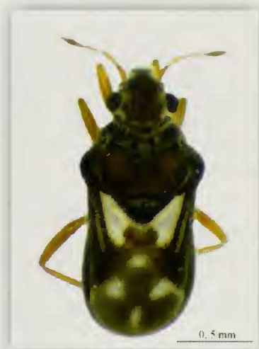
Fig. 7.- Habitus de Merragata hebroides W. (♂)

Se encuentra en el detritus o sobre algas filamentosas en superficie ( Spyrogira , por ejemplo); en los remansos y pozas de los cauces de los barrancos, en las charcas y en las obras de infraestructura de regadío. Igual que en el caso anterior, en muchos de los enclaves acuáticos visitados se ha colectado junto con Mesovelina vittigera H. y Microvelia ( Microvelia ) gracillima R.